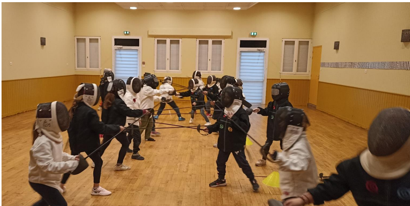
Les enfants de l'école se préparent aux JO 2024.